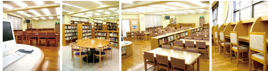
検索システム 読書へのいざない 閲覧室 学習ブース