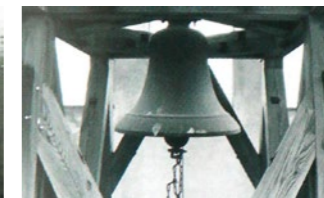
1955年 第一回卒業記念 アンジェラスの鐘寄贈