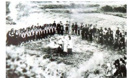
1949年 校舎工事定礎式