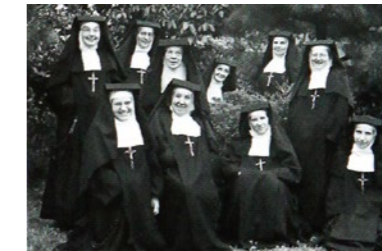
1948年 創立時代のシスターたち